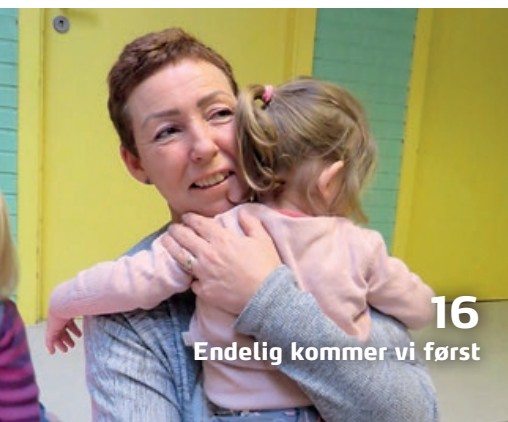
16 Endelig kommer vi først